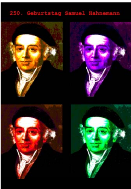
250. Geburtstag Samuel Hahnemann